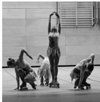
Den Abschluss bildete der Show-Vierer des Rad- und Rollschuhvereins Eppingen mit einer gelungenen Vorführung.