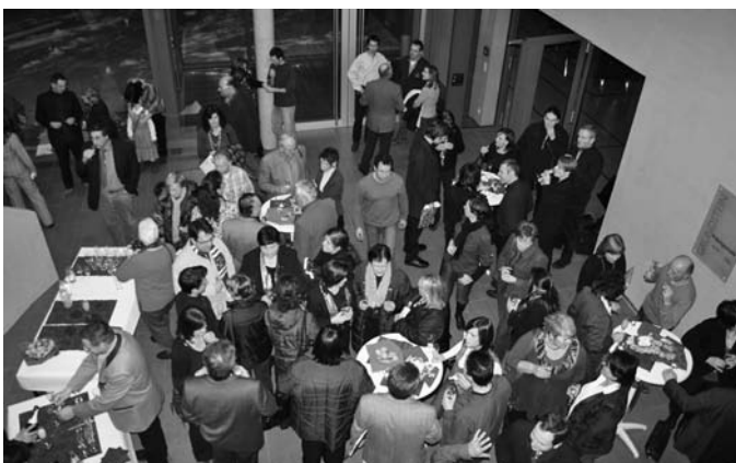
Nach einem gelungenen bunten Programm ließen die rund 200 Gäste den Abend gemütlich ausklingen.