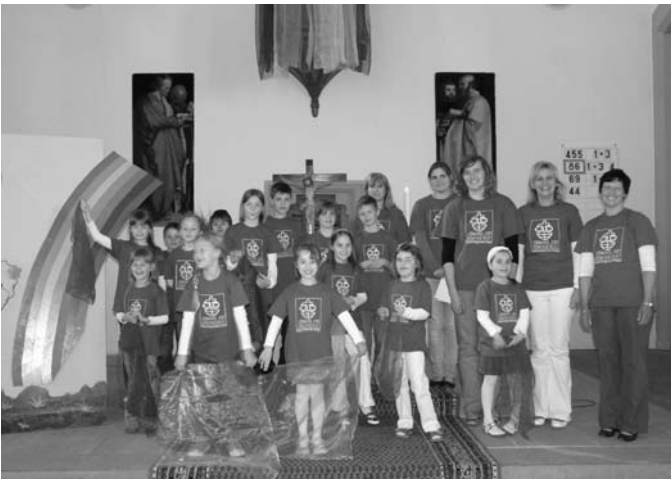
Das Foto zeigt die Evangelischen vom Kindergottesdienst beim Singen in der regenbogenfarbig geschmückten Kirche.