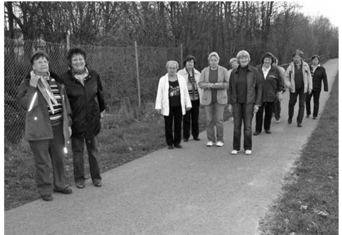
Lauftreff in den Ferien

Wir wünschen der Bevölkerung von Gemmingen und Stebbach schöne Pfingstferien.