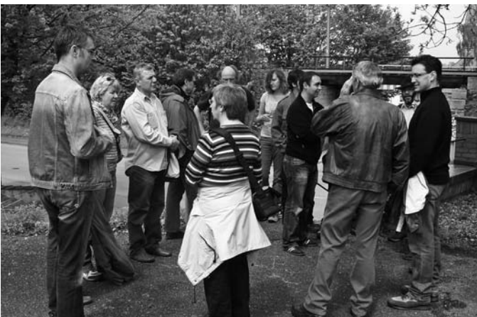
Treffpunkt am Bauhof