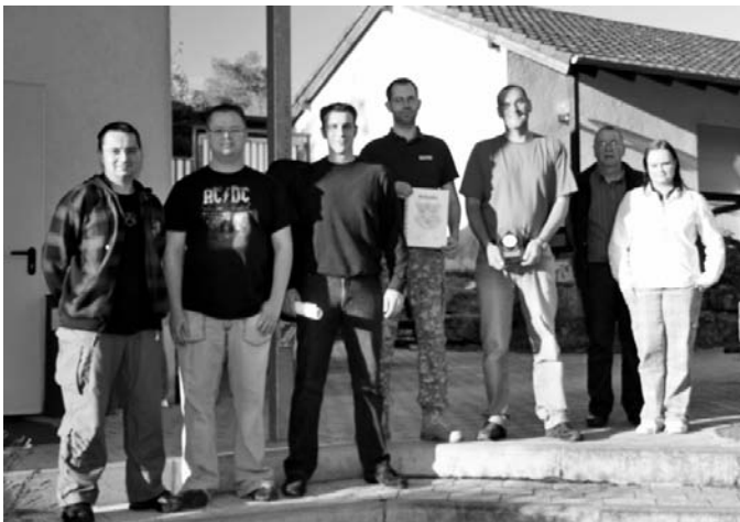
Das Bild zeigt die erfolgreichen Schützen.

Herzlichen Glückwunsch und weiterhin „Gut Schuss“.