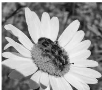
Bienenwolfkäfer auf einer Margarete (Foto: 5.6.2020 im NABU Kräutergarten)