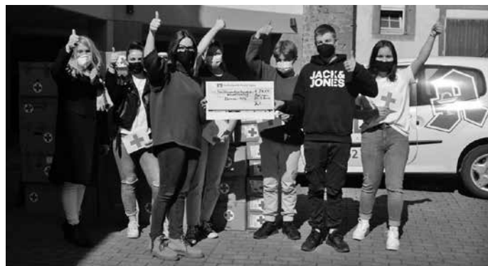
5451 Euro Spenden für die Ukraine wurden an den Campusschulen Eppingen gesammelt.

Stolz sein darf die Schülerschaft der Campusschulen von Eppingen: der Selma-Rosenfeld-Realschule, der Hellbergsschule und des Hartmanni-Gymnasiums. Nachdem am Donnerstag, 17.03., die Schülerschaft mit einer langen Menschenkette ihrem Wunsch nach Frieden Ausdruck gegeben hat, begann sie mit einer Sammelaktion für die Menschen, die in der Ukraine unter dem Krieg leiden. Als Partner konnte die Salzl Apotheke Eppingen gewonnen werden, die für die Spendensumme Medikamente zum Einkaufspreis bereitstellte. Eine Elternsprecherin des Hartmanni-Gymnasiums stellte Verbindungen zu einem Transport her, der die Medikamente über Tschechien und Polen direkt nach Kiew bringt, wo sie an Personen übergeben werden, zu denen ein persönlicher Kontakt besteht und von denen auch eine Liste mit benötigtem medizinischem Material übermittelt wurde. So konnte sichergestellt werden, dass die Spende auch wirklich das beinhaltet, was benötigt wird, und dort ankommt, wo es gebraucht wird.