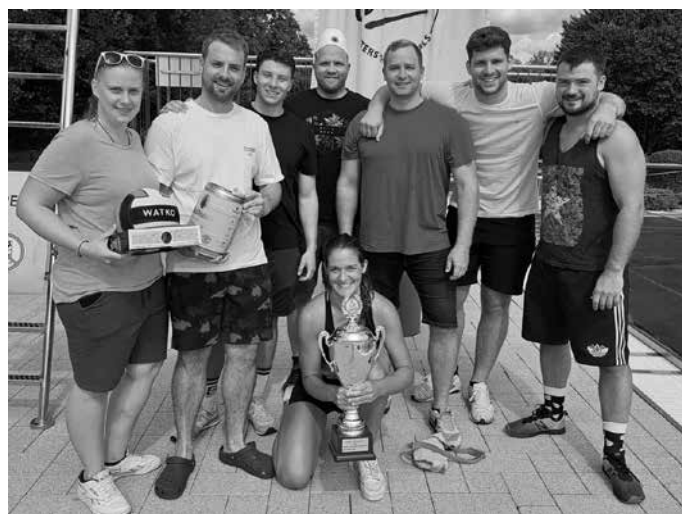
Siegemannschaft WSV Vorwärts Ludwigshafen.

Die Mannschaft WSV Vorwärts Ludwigshafen mit einigen Zweit-Liga-Spielern hat das Herren-Wasserballturnier der Wasserfreunde Gemmingen durch einen 12:6-Sieg im Endspiel gegen SV Friedrichsthal Masters gewonnen. Den dritten Platz sicherte sich der PSV Stuttgart vor der gemischten Turnierrangliste Team Inteam rund um Spieler des Bundesligisten SV Ludwigsburg. Der BSC Pforzheim gewann das Spiel um den fünften Platz gegen den SV Friedrichsthal. Die Gastgeber konnten den siebten Platz durch einen Sieg gegen die zweite Mannschaft des PSV Stuttgart, welche unter dem Turniernamen „PSV Bierliebe“ antraten, erkämpfen.