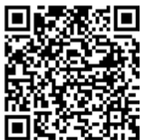
Meldeplattform Asiatische Hornisse

Um möglichst rasch Maßnahmen zum Fang der Königinnen und Beseitigung der Nester der Asiatischen Hornisse zu veranlassen, bittet das Ministerium für Umwelt, Klima und Energiewirtschaft um Meldung von Sichtungen in Baden-Württemberg. Dies ist über die Meldeplattform auf der Homepage der Landesanstalt für Umwelt (LUBW), aber auch über die kostenlose „Meine Umwelt-App“ möglich: